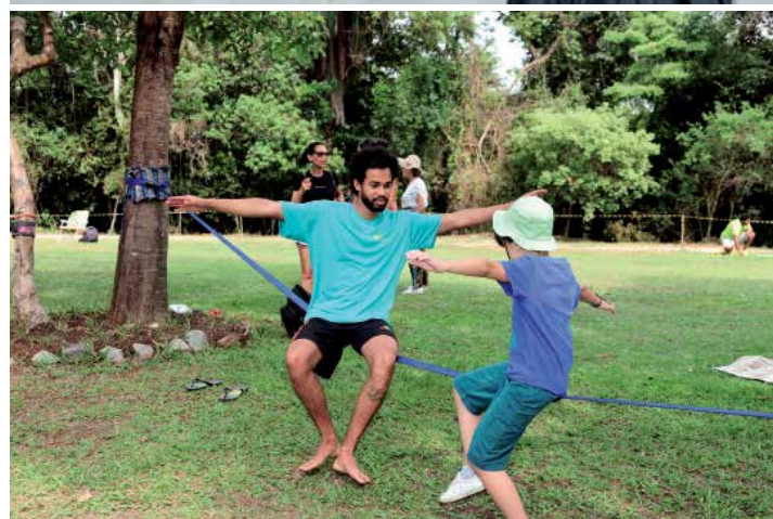
Bike Anjo, dança cigana e slackline estão entre as atrações do evento

de extensão e pesquisa universitária, não será permitida a entrada de animais de estimação. Com 114 hectares, a Estação Ecológica é habitat de várias espécies de mamíferos, anfíbios, répteis e aves.