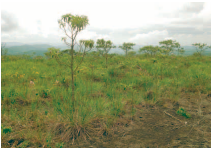
Paisagem de cerrado: mais de 1,9 milhão de hectares destruídos de 2013 a 2015

“No entanto, os efeitos do PPBio vão muito além da própria coleta de dados. O Programa contribuiu para o estabelecimento de capacidade e infraestrutura de pesquisas ecológicas, incluindo coleções científicas, especialmente em áreas remotas e virtualmente desconhecidas do país”, enfatiza o artigo.