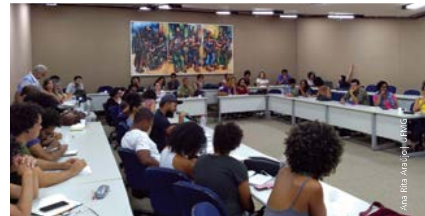
Atividade de formação realizada no campus Pampulha no último dia 12

O procedimento, segundo ele, tem respaldo jurídico na Arguição de Descumprimento de Preceito Fundamental (ADPF) 186, aprovada em 2012 pelo Supremo Tribunal Federal, ao examinar a compatibilidade com a Constituição Federal dos programas de ação afirmativa que estabelecem reserva de vagas, com base em critério étnico-racial, para acesso ao ensino superior. De acordo com a decisão, o julgamento, por comitês posteriores à autoidentificação pelo candidato, “deve ser realizado por fenótipo e não por ascendência”.