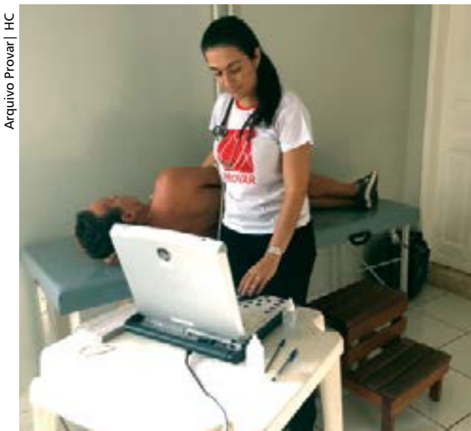
HC Profissional do Provar processa ecocardiograma simplificado: aparelhagem menos complexa e de menor custo