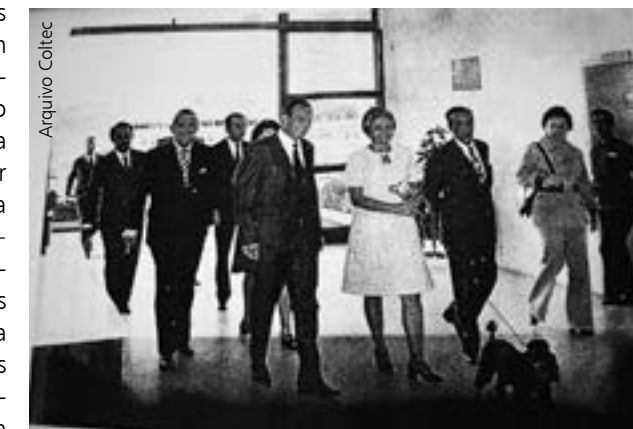
Inauguração do prédio do Coltec em 1969

Fotografias das décadas de 1960 e 70 que retratam a construção e a inauguração do Colégio Técnico (Coltec), suas salas de aula e laboratórios podem ser vistas até 30 de abril, na exposição Memórias e momentos , instalada na biblioteca da unidade, no campus Pampulha. A mostra é uma homenagem aos 50 anos do Colégio, que serão comemorados no próximo dia 28 de abril.