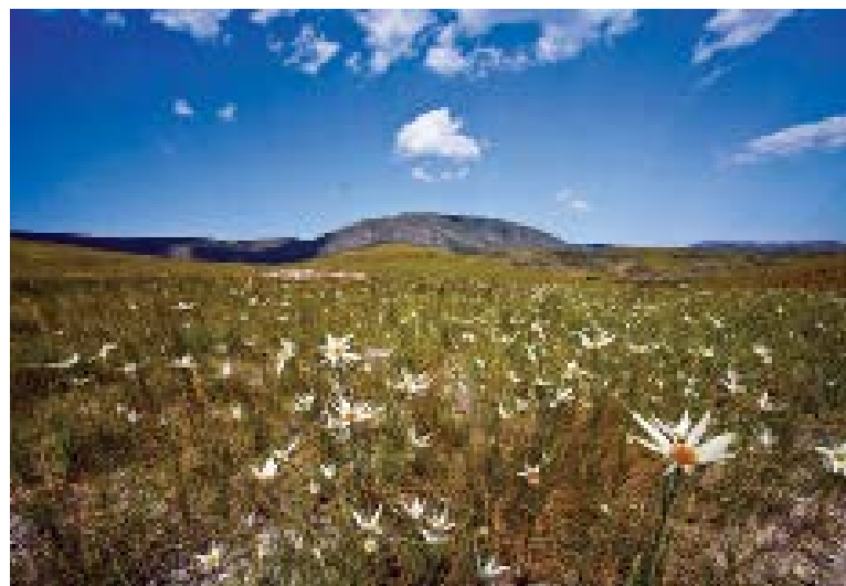
Serra do Espinhaço, uma das áreas de conservação em Minas Gerais

Em dezembro passado, cerca de 90 pesquisadores de Minas Gerais e de outras regiões do país participaram, no campus Pampulha, de oficina que discutiu áreas e metas de conservação. De acordo com o IEF, na reunião “foram avaliados o conjunto de alvos propostos pela coordenação temática do projeto e as contribuições obtidas