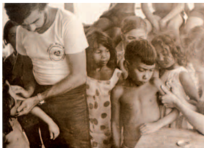
Revista Interior/Ministério do Interior

O projeto recebeu esse nome em homenagem ao marechal Cândido Rondon, sertanista que no início do século 20 liderou missão do Exército destinada a integrar o Centro-Oeste brasileiro. A iniciativa teve origem em conclusões de seminário sobre educação e segurança nacional realizado em 1966, culminando com a decisão de aproximar estudantes e militares. “O objetivo de levar ao interior assistência social e apoio à infraestrutura era secundário – o estudante era a razão de existir do projeto. Principalmente em momentos de crise estudantil, como em 1968 e 1977, o regime