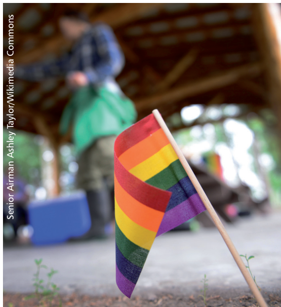
Bandeira do movimento LGBT, cujos temas despertam interesse crescente na comunidade científica da UFMG