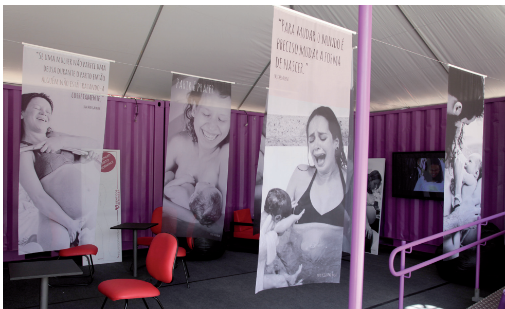
Exposição orienta sobre os prejuízos causados pelas cesarianas à saúde da mulher e do bebê

A Formação em Extensão Universitária é definida como mecanismo para a integralização de créditos em cursos de graduação, mediante a participação dos estudantes em atividades optativas integrantes de programas ou projetos de extensão universitária.