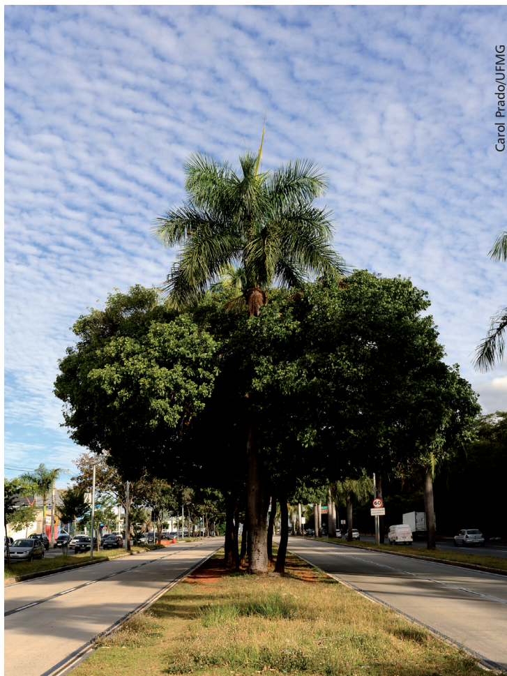
Sibipiruna é a espécie de árvore mais comum na região Centro-Sul

De acordo com o Sistema de Inventário de Árvores de Belo Horizonte (SIIA-BH), a região Centro-Sul abriga, em seus logradouros